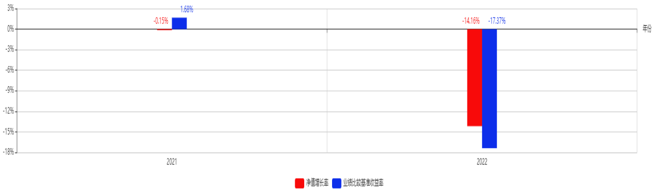
基金每年的净值增长率及与同期业绩比较基准的比较图