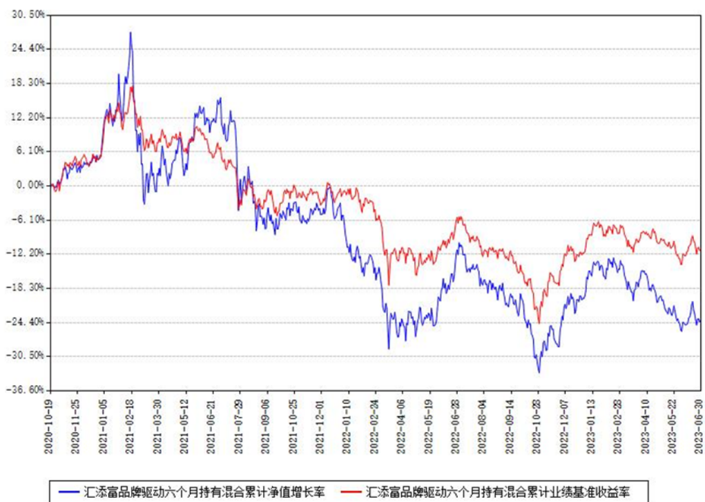
汇添富品牌驱动六个月持有混合累计净值增长率与同期业绩基准收益率对比图