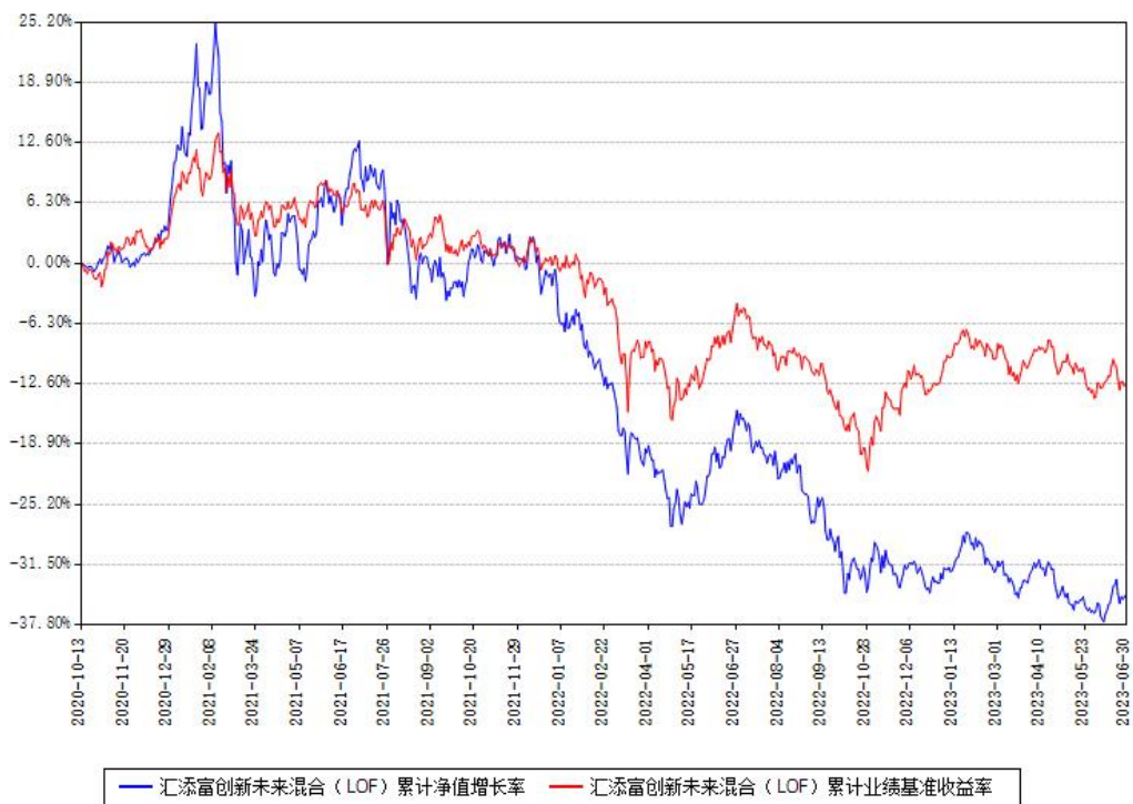
汇添富创新未来混合（LOF）累计净值增长率与同期业绩基准收益率对比图