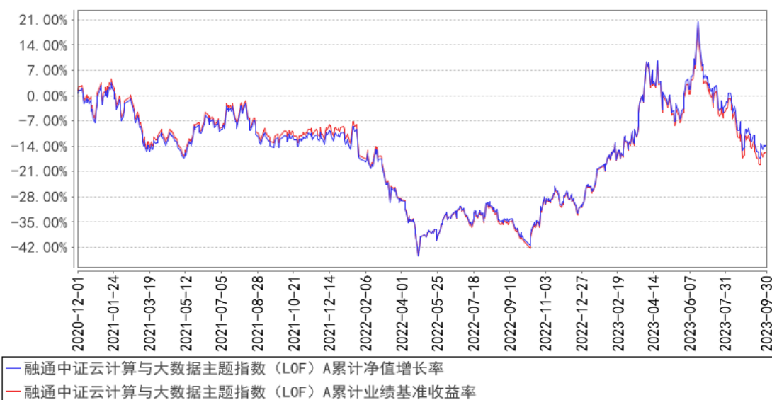
融通中证云计算与大数据主题指数（LOF）A 累计净值增长率与同期业绩比较基准收益率的历史走势对比图