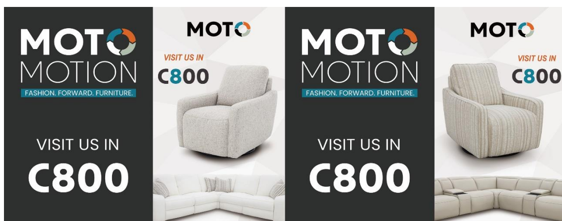
MOTOMOTION 2023 年 10 月匠心在美国高点展览会的主会场所做的户外广告 FASHION. FORWARD. FURNITURE.