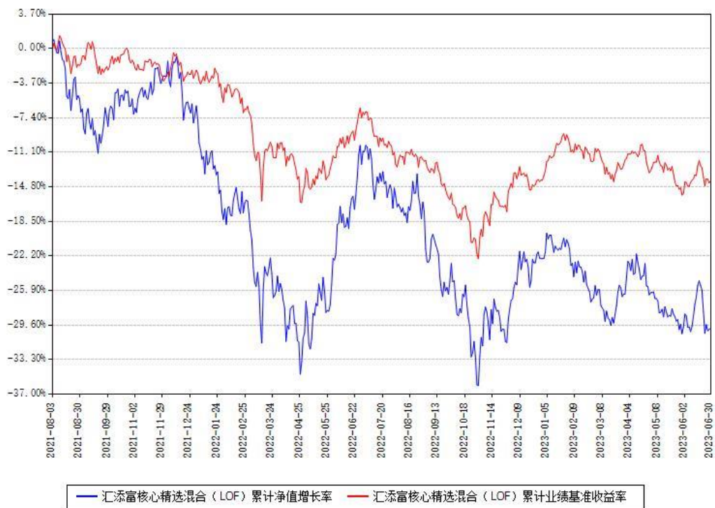
汇添富核心精选混合（LOF）累计净值增长率与同期业绩基准收益率对比图