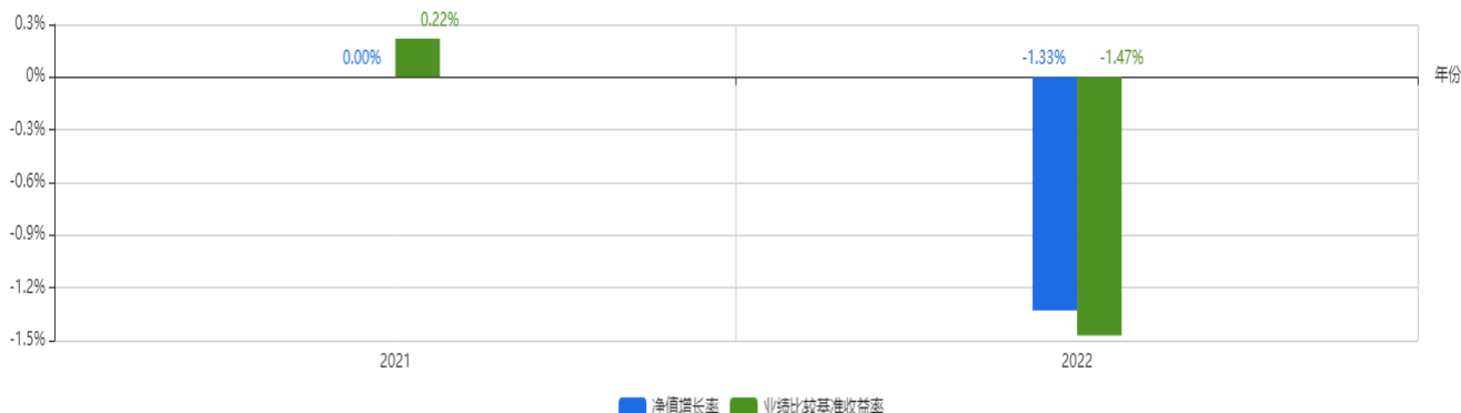
基金每年的净值增长率及与同期业绩比较基准的比较图