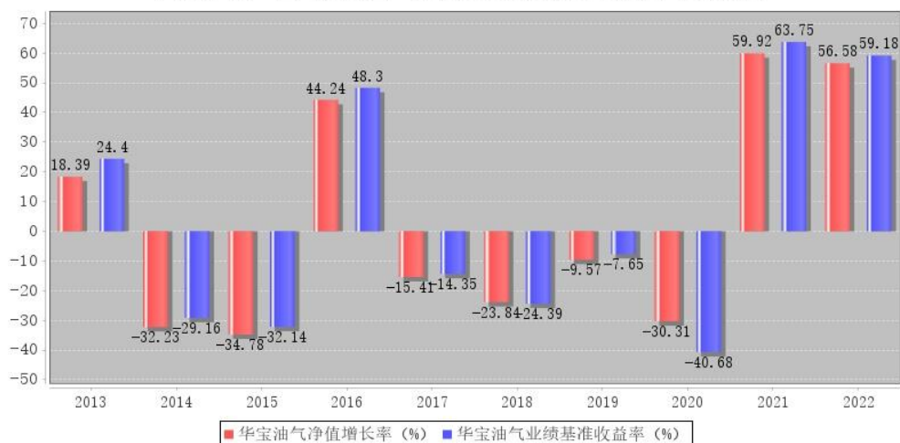
华宝油气每年净值增长率与同期业绩比较基准收益率的对比图