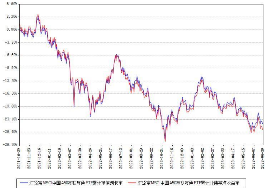
汇添富MSCI中国A50互联互通ETF累计净值增长率与同期业绩基准收益率对比图