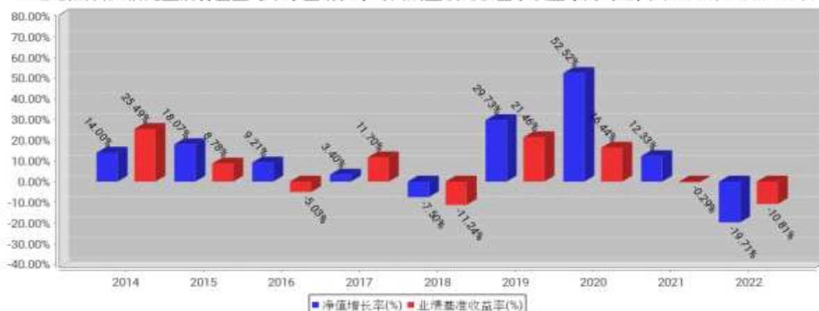
工银新财富灵活配置混合基金每年净值增长率与同期业绩比较基准收益率的对比图（2022年12月31日）

注：1、本基金基金合同于 2014 年 09 月 19 日生效。合同生效当年不满完整自然年度的，按实际期限计算净值增长率。