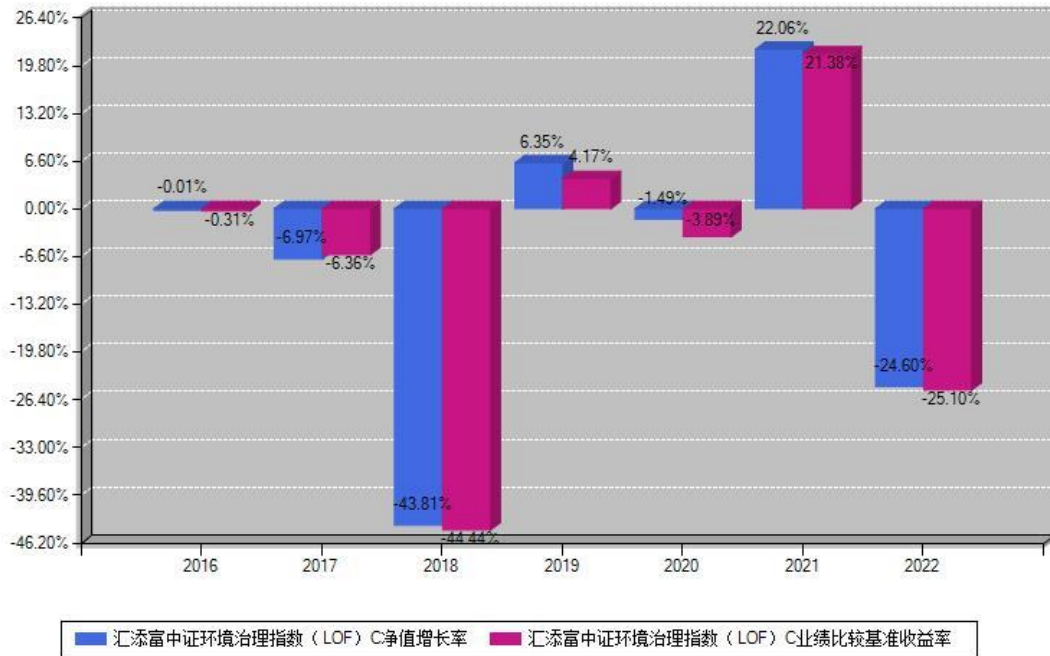
汇添富中证环境治理指数 (LOF) C 每年净值增长率与同期业绩基准收益率对比图

注：基金的过往业绩不代表未来表现。本《基金合同》生效之日为2016年12月29日，合同生效当年按实际存续期计算，不按整个自然年度进行折算。