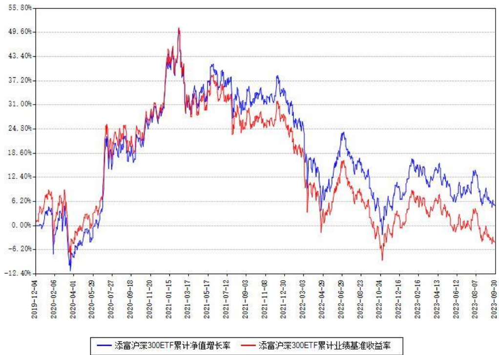
添富沪深300ETF累计净值增长率与同期业绩基准收益率对比图