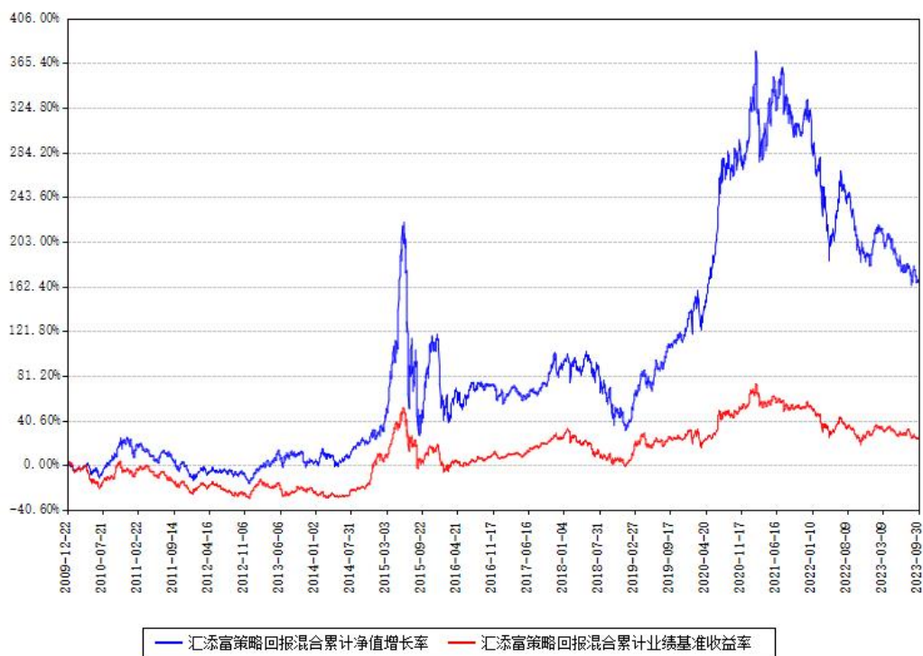
汇添富策略回报混合累计净值增长率与同期业绩基准收益率对比图