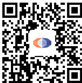
国泰君安资管 APP 下载二维码

投资者可以在应用市场搜索“国泰君安资管”，或者扫描下方二维码，下载国泰君安资管 APP，了解基金产品、服务等信息。