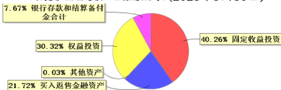
投资组合资产配置图表 (2023年9月30日)

● 固定收益投资 ● 买入返售金融资产 ● 其他资产 ● 权益投资 ● 银行存款和结算备付金合计