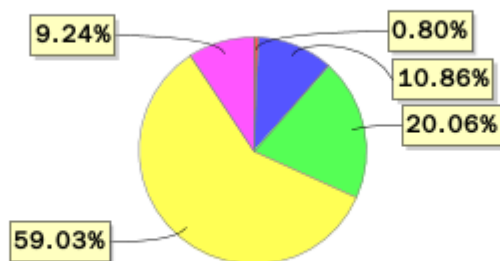
投资组合资产配置图表(2023年6月30日)

● 固定收益投资 ● 买入返售金融资产 ● 其他资产 ● 权益投资 ● 银行存款和结算备付金合计