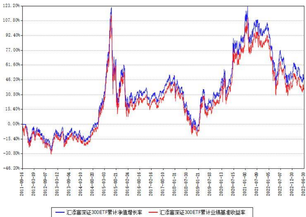
汇添富深证300ETF累计净值增长率与同期业绩基准收益率对比图