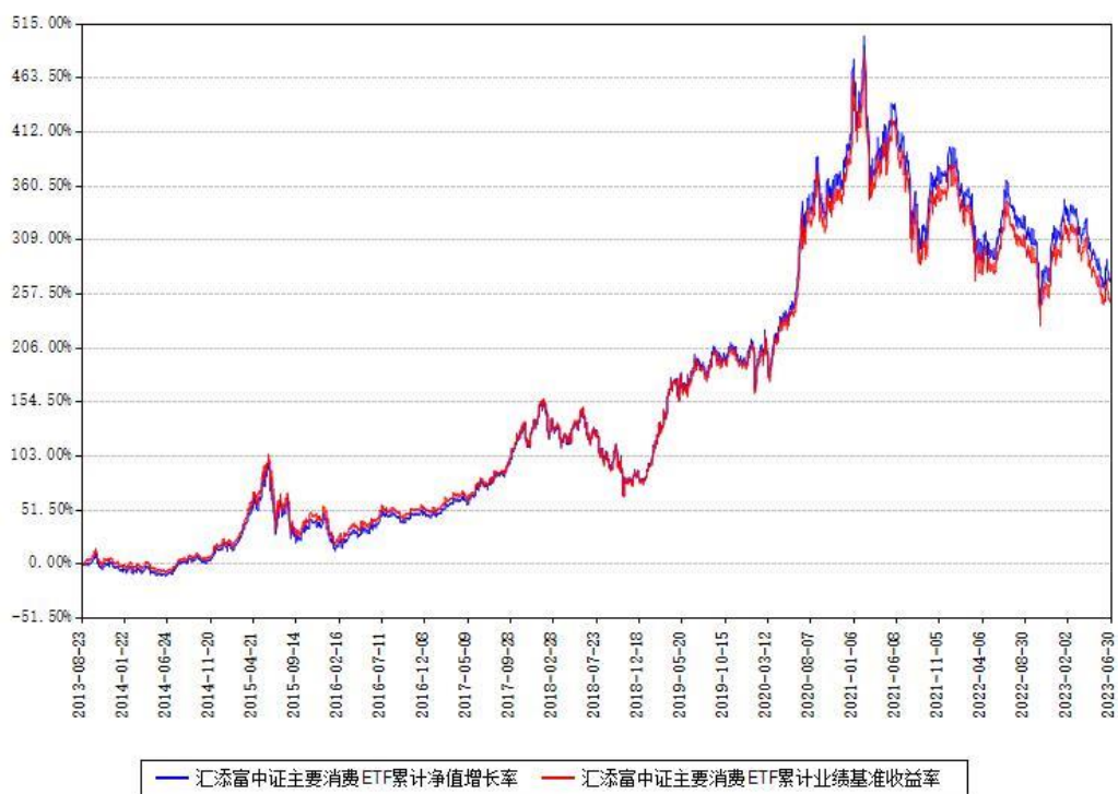
汇添富中证主要消费ETF累计净值增长率与同期业绩基准收益率对比图