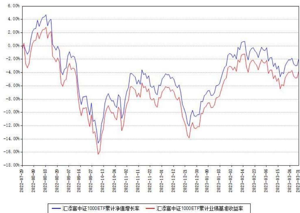
汇添富中证1000ETF累计净值增长率与同期业绩基准收益率对比图

(二) 自基金合同生效以来基金累计净值增长率变动及其与同期业绩比较基准收益率变动的比较图