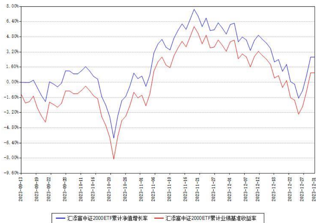
汇添富中证2000ETF累计净值增长率与同期业绩基准收益率对比图