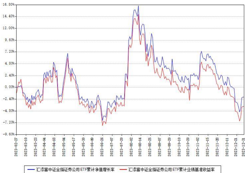
汇添富中证全指证券公司ETF累计净值增长率与同期业绩基准收益率对比图