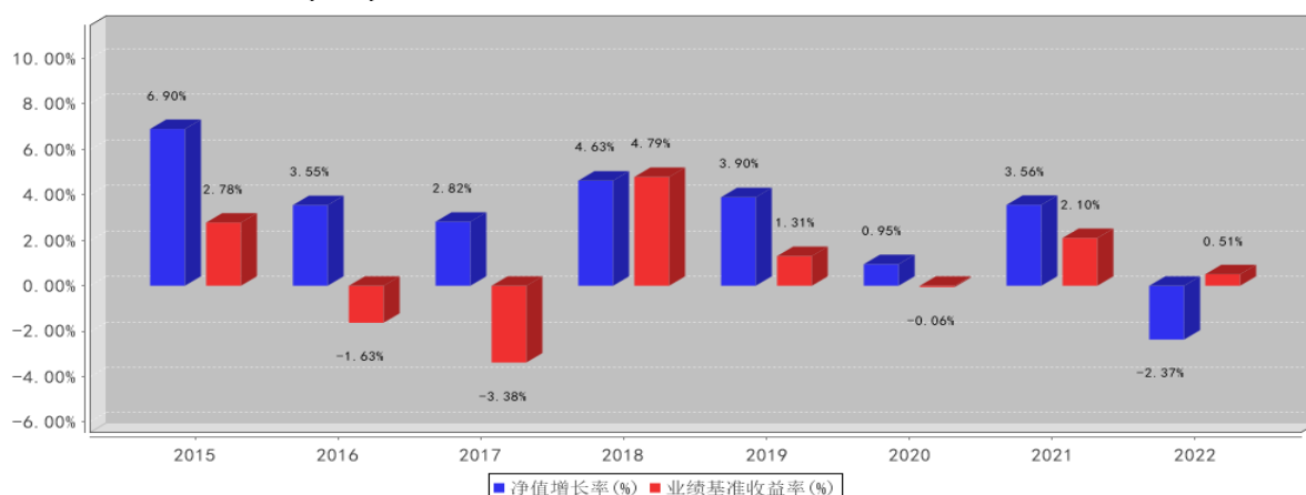
国联安双佳信用债券(LOF)基金每年净值增长率与同期业绩比较基准收益率的对比图2022年12月31日