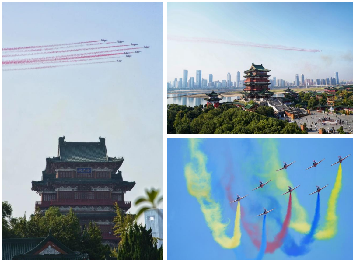
组图 3：“红鹰”献艺，K8 基础教练机飞跃滕王阁，献礼“南昌飞行大会”

报告期内，公司成功组织或配合完成了国家和省、市多项重大活动，全力配合保障“2023 中国航空产业大会暨南昌飞行大会”顺利举行，南昌飞行大会保障案例入选航空工业大安全管理成果。