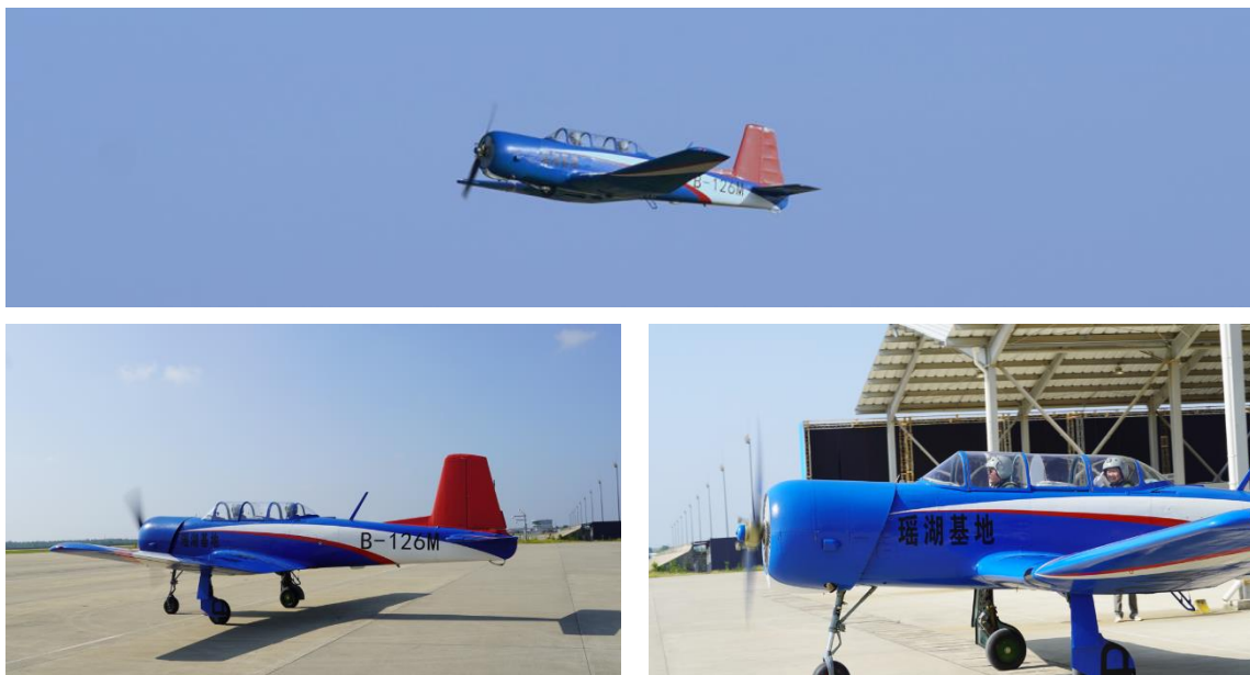
组图 2：“雏鹰”试翼，民用 CJ6 初级教练机试航瑶湖机场

报告期内，公司成功组织或配合完成了国家和省、市多项重大活动，全力配合保障“2023 中国航空产业大会暨南昌飞行大会”顺利举行，南昌飞行大会保障案例入选航空工业大安全管理成果。