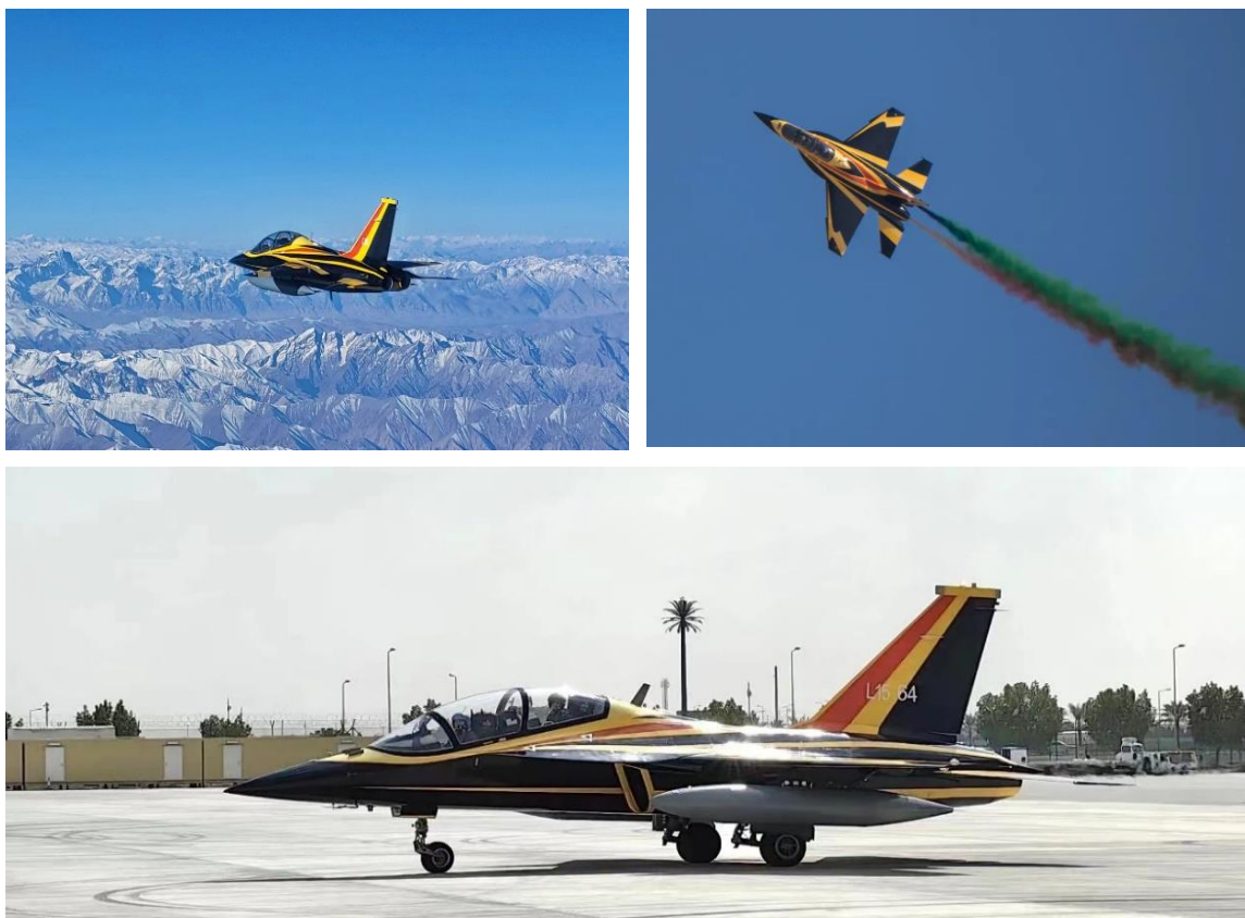
组图 1：“猎鹰”亮翅，L15 高级教练机新涂色亮相迪拜国际航展

报告期内，国际市场开拓取得积极进展，L15 高教机亮相迪拜国际航展，以其为代表的公司产品系列引起参展用户的广泛、深度关注和积极对接，公司作为中国教练机基地的品牌效应和国际知名度大幅提升。