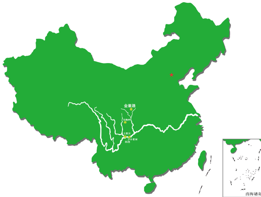
秦岭南麓森林河谷美酒区