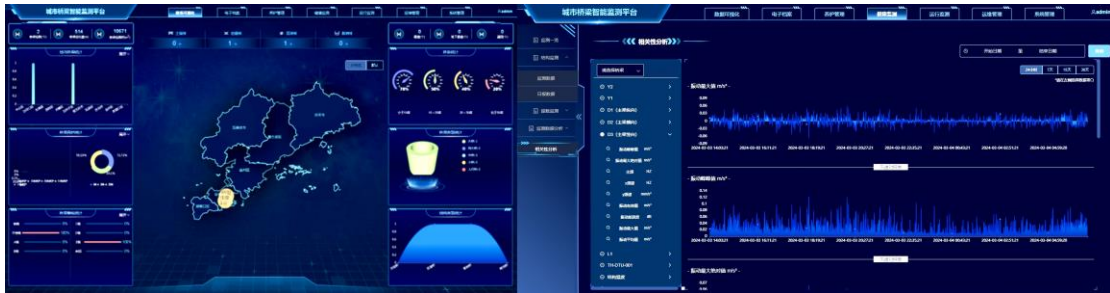
图示：城市桥梁智慧监测平台

大型基础设施监/检测与运维的“城市桥梁智慧监测平台”、“钢结构无损检测智慧管理平台”及“大型基础设施（BRT）健康档案系统”。报告期内，公司自主研发的“城市桥梁智慧监测平台”、“钢结构无损检测智慧管理平台”分别在大连市大型基建维修项目和厦门翔安大桥检测项目的应用中取得显著成效。