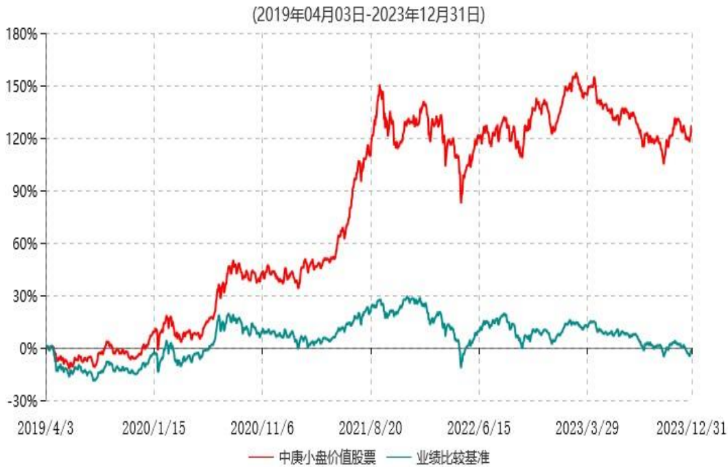
中庚小盘价值股票型证券投资基金累计净值增长率与业绩比较基准收益率历史走势对比图