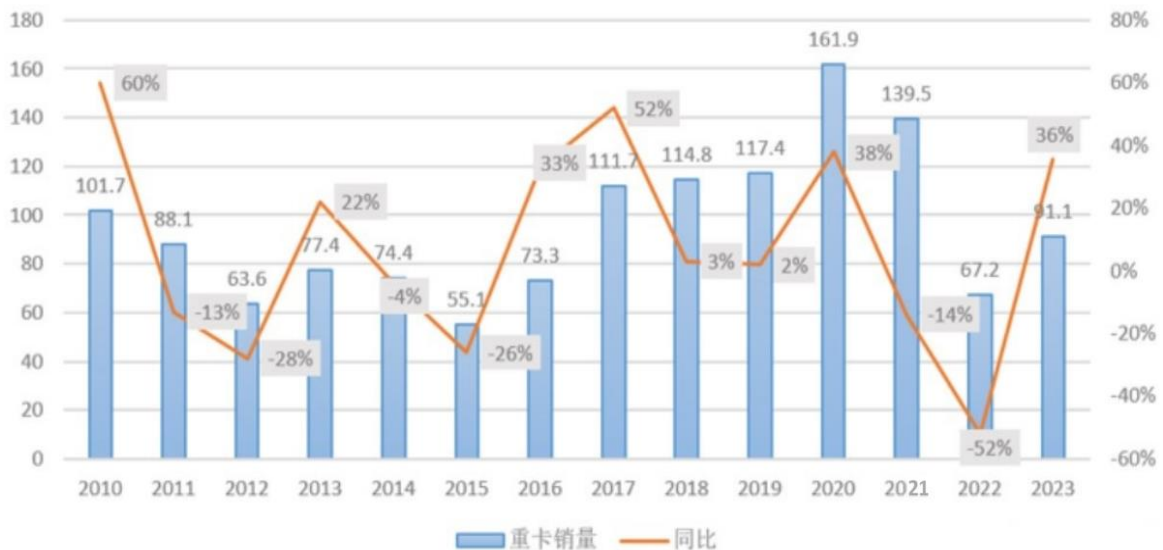
2010-2023 年重卡市场销量年度走势 (单位: 万辆)

公司积极应对国内外市场复杂形势和挑战，以打造世界一流的全系列商用车集团为目标，始终坚持问题导向、改革创新、开拓进取，通过加快产品优化升级和结构调整，持续提升产品质量和产品竞争力，通过精准实施营销策略，深耕国内细分市场，在重点细分市场取得全面突破。燃气车成功抓住市场机遇，产品出口销量再创历史新高。公司整体盈利能力得到进一步提升。2023 年度累计实现重卡销售 12.8 万辆，同比上升 32.8%；实现销售收入 420.7 亿元，同比上升 46%；实现归属于母公司净利润 10.8 亿元，同比上升 406%。实现了公司高质量健康运行。