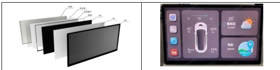
公司车载显示模组