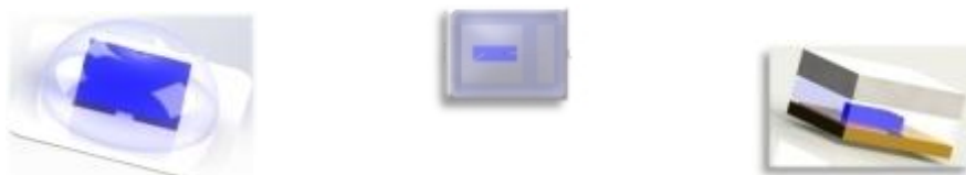
公司 MiniLED 背光器件

公司新型显示制造端产品包括直下式背光模组光电系统、侧入式背光模组光电系统、量子点显示光电系统与 Mini LED 背光显示光电系统。液晶显示作为当前最主要的显示技术，近年来随着消费升级及技术进步，不断朝着高清、高亮度、高色域超轻薄方向发展。公司注重显示技术的不断创新，解决客户痛点及市场需求，先后完成了超轻薄 OD10 直下式背光模组光电系统，灯驱一体全倒装 COB MiniLED 背光显示光电系统，灯驱一体 POB MiniLED 背光显示光电系统，车载 Mini 背光显示光电系统、倒装大功率高光效直下式背光模组光电系统等新产品开发设计，并成功批量应用于国内一线品牌客户创维、海信、小米、华为智慧屏等终端客户。公司侧入式背光模组光电系统采用高光效光源 LED 封装，超窄结构设计，具有长寿命可靠性、光衰小、色坐标偏移小，节能护眼等特点，不仅被国内一线电视品牌客户广泛采用，也应用于超薄电脑显示器终端满足 LG、三星、惠普、华为等客户需求。公司车载 Mini 背光显示光电系统可直接作为显示模组，其他背光模组光电系统是显示模组的重要组成部分。