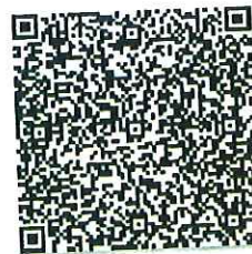
朱理理的年检二维码

本证书经检验合格，继续有效一年。 This certificate is valid for another year after this renewal.