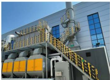
活性炭吸附催化燃烧