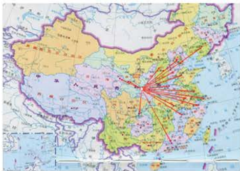
供应商区域分布图

2023年公司共有主要合格供应商164家,遍布于全国18个省、直辖市。公司对合格供应商进行动态管理,依据公司管理制度对公司所有供应商质量保证能力进行考核评价,接纳新供应商准入,淘汰评价不合格的供应商。公司对供应商质量保证能力进行持续监测和统计,及时发现供应商质量异常情况并指导监督供应商质量改进,与供应商共同成长。