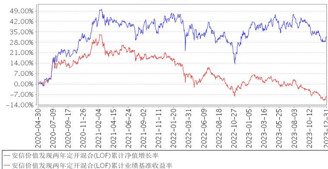
安信价值发现两年定开混合(LOF)累计净值增长率与同期业绩比较基准收益率的历史走势对比图