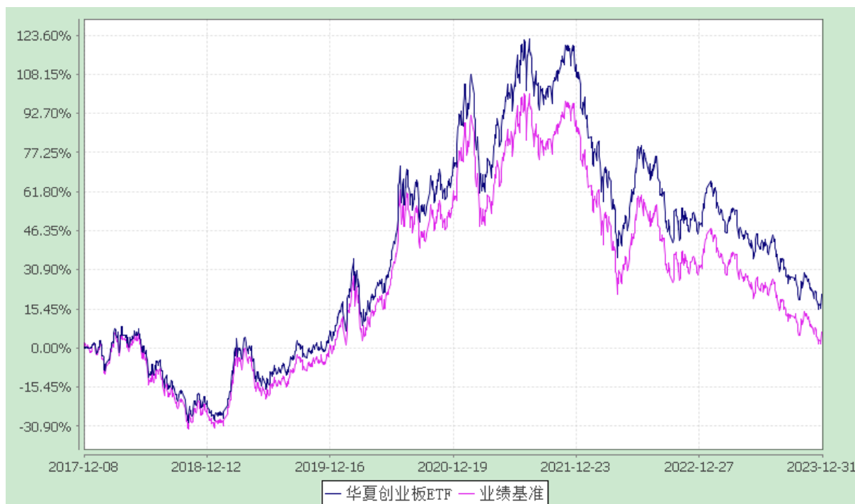
华夏创业板交易型开放式指数证券投资基金 份额累计净值增长率与业绩比较基准收益率历史走势对比图 (2017年12月8日至2023年12月31日)