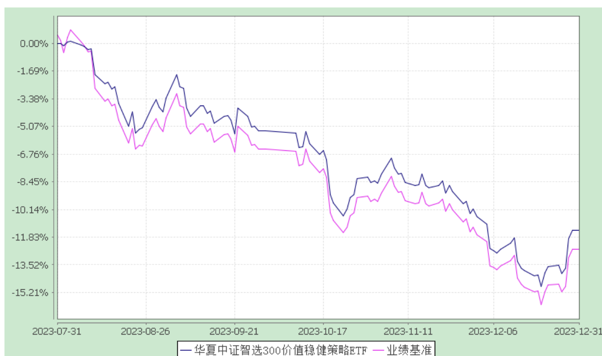
华夏中证智选 300 价值稳健策略交易型开放式指数证券投资基金 份额累计净值增长率与业绩比较基准收益率历史走势对比图 (2023 年 7 月 31 日至 2023 年 12 月 31 日)