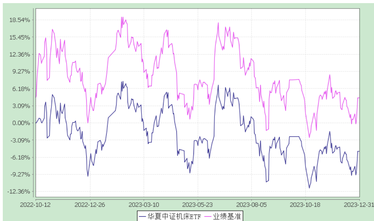
华夏中证机床交易型开放式指数证券投资基金 份额累计净值增长率与业绩比较基准收益率历史走势对比图 (2022 年 10 月 12 日至 2023 年 12 月 31 日)

注：根据本基金的基金合同规定，本基金自基金合同生效之日起 6 个月内使基金的投资组合比例符合本基金合同中投资范围、投资限制的有关约定。