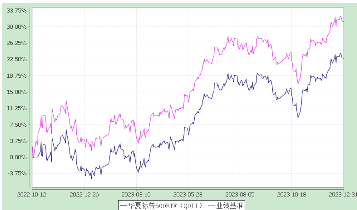
华夏标普 500 交易型开放式指数证券投资基金 (QDII) 基金份额累计净值增长率与业绩比较基准收益率的历史走势对比图 (2022 年 10 月 12 日至 2023 年 12 月 31 日)

注：根据本基金的基金合同规定，本基金自基金合同生效之日起 6 个月内使基金的投资组合比例符合本基金合同中投资范围、投资限制的有关约定。