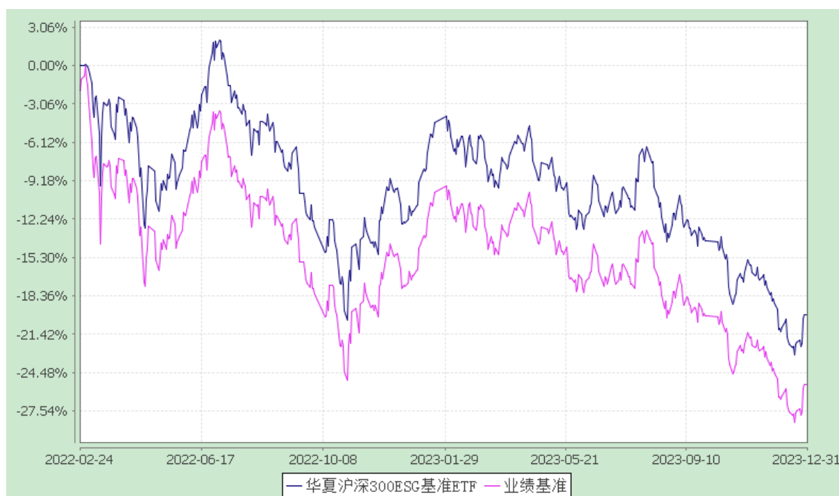
华夏沪深 300ESG 基准交易型开放式指数证券投资基金 份额累计净值增长率与业绩比较基准收益率历史走势对比图 (2022 年 2 月 24 日至 2023 年 12 月 31 日)