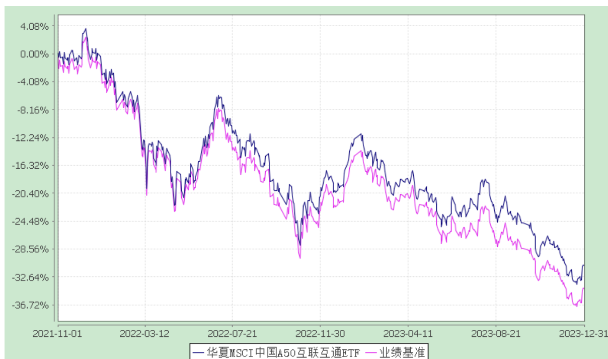
华夏 MSCI 中国 A50 互联互通交易型开放式指数证券投资基金 份额累计净值增长率与业绩比较基准收益率历史走势对比图 (2021 年 11 月 1 日至 2023 年 12 月 31 日)