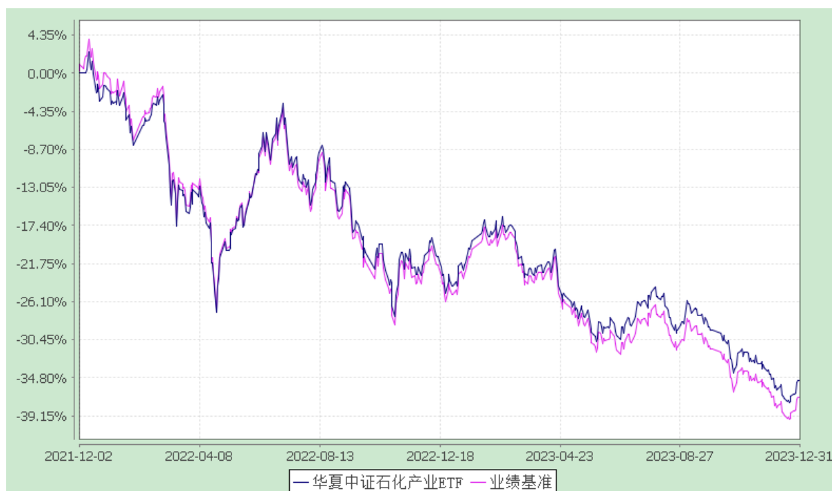
华夏中证石化产业交易型开放式指数证券投资基金 份额累计净值增长率与业绩比较基准收益率历史走势对比图 (2021年12月2日至2023年12月31日)