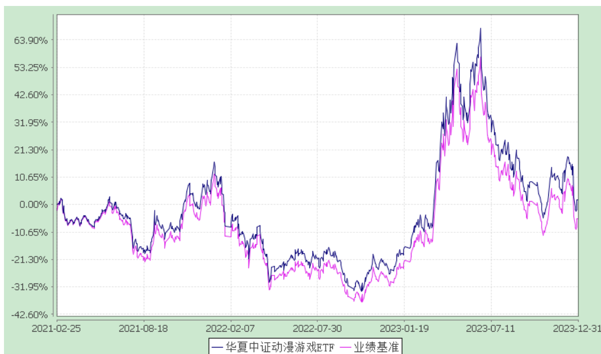
华夏中证动漫游戏交易型开放式指数证券投资基金 份额累计净值增长率与业绩比较基准收益率历史走势对比图 (2021年2月25日至2023年12月31日)