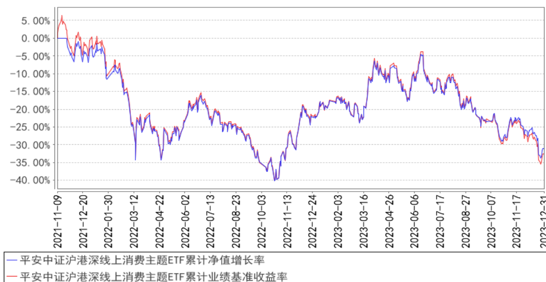
平安中证沪港深线上消费主题ETF累计净值增长率与同期业绩比较基准收益率的历史走势对比图