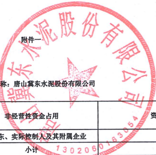
2023年度非经营性资金占用及其他关联资金往来情况汇总表