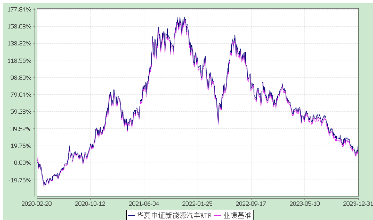
华夏中证新能源汽车交易型开放式指数证券投资基金 份额累计净值增长率与业绩比较基准收益率历史走势对比图 (2020年2月20日至2023年12月31日)