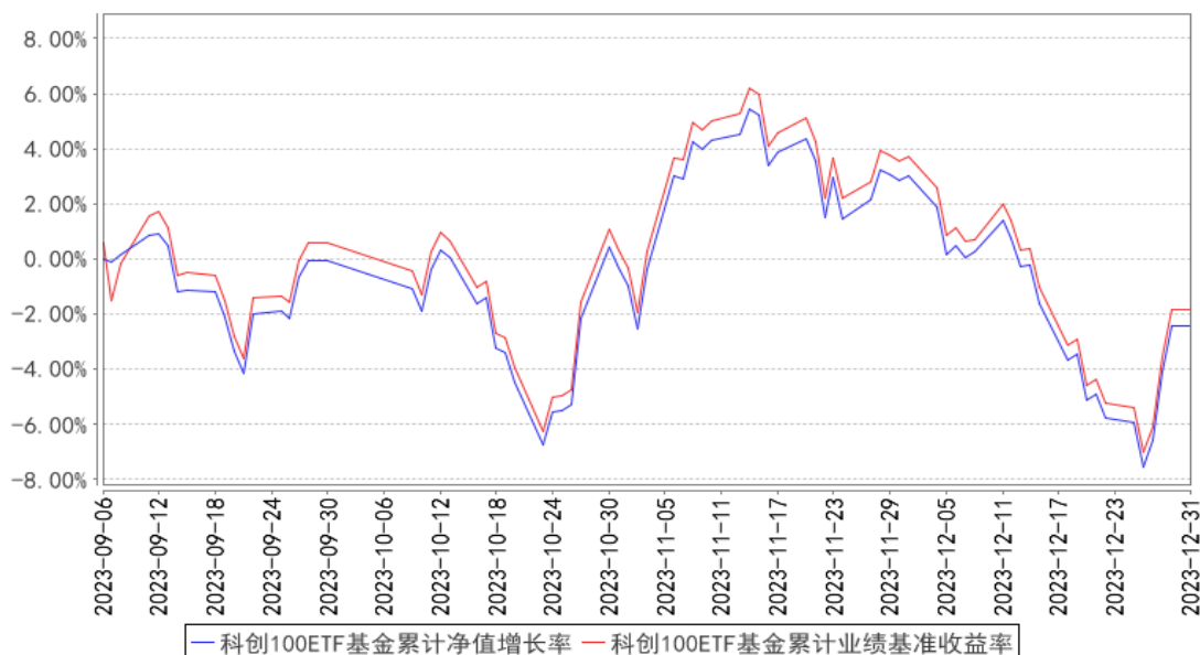
科创100ETF基金累计净值增长率与同期业绩比较基准收益率的历史走势对比图

注：1、本基金基金合同于2023年09月06日生效，截至本报告期末本基金基金合同生效未满一年。2、本基金管理人将严格按照本基金合同的约定，于本基金建仓期届满后确保各项投资比例符合本基金合同的约定。