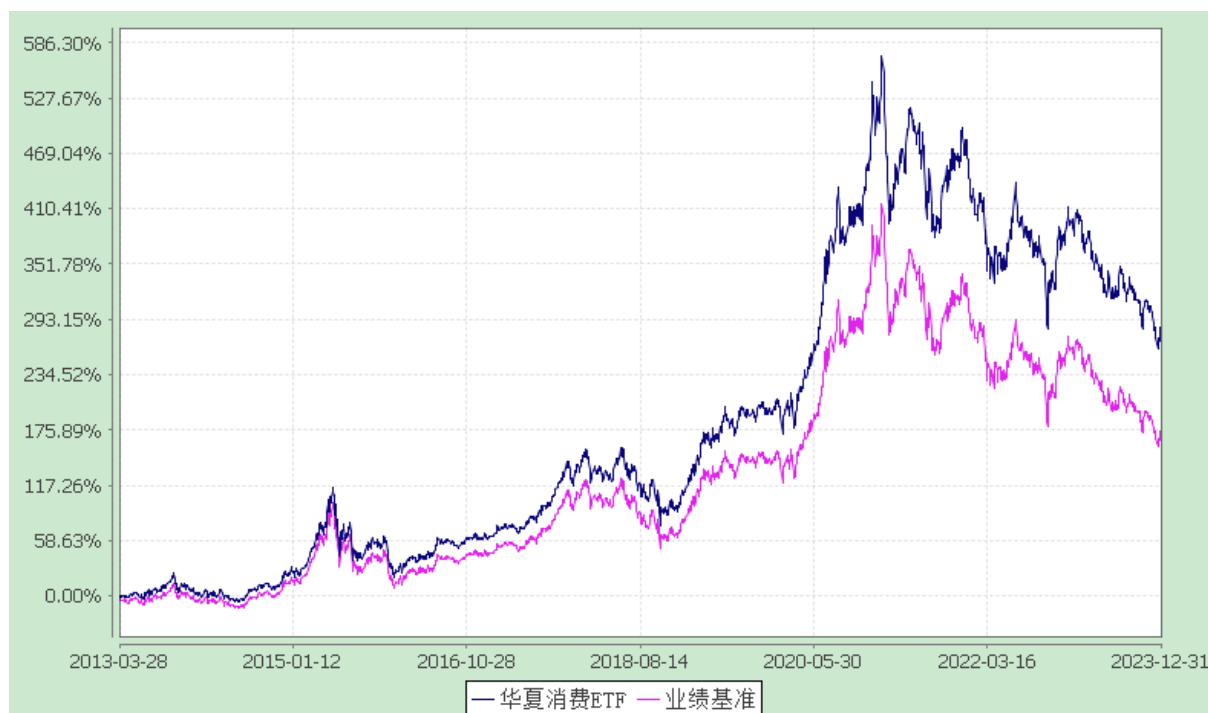
上证主要消费交易型开放式指数发起式证券投资基金 份额累计净值增长率与业绩比较基准收益率历史走势对比图 (2013年3月28日至2023年12月31日)