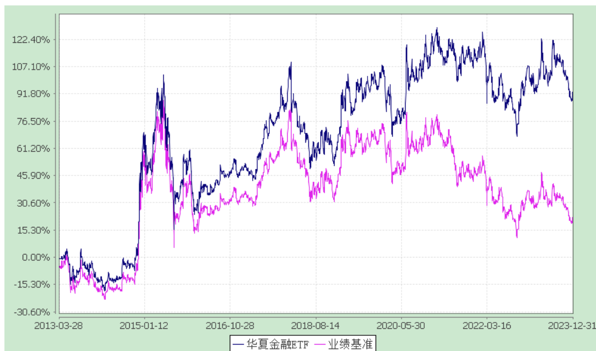
上证金融地产交易型开放式指数发起式证券投资基金 份额累计净值增长率与业绩比较基准收益率历史走势对比图 (2013年3月28日至2023年12月31日)