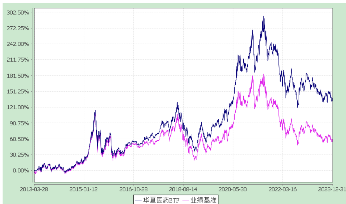
上证医药卫生交易型开放式指数发起式证券投资基金 份额累计净值增长率与业绩比较基准收益率历史走势对比图 (2013年3月28日至2023年12月31日)