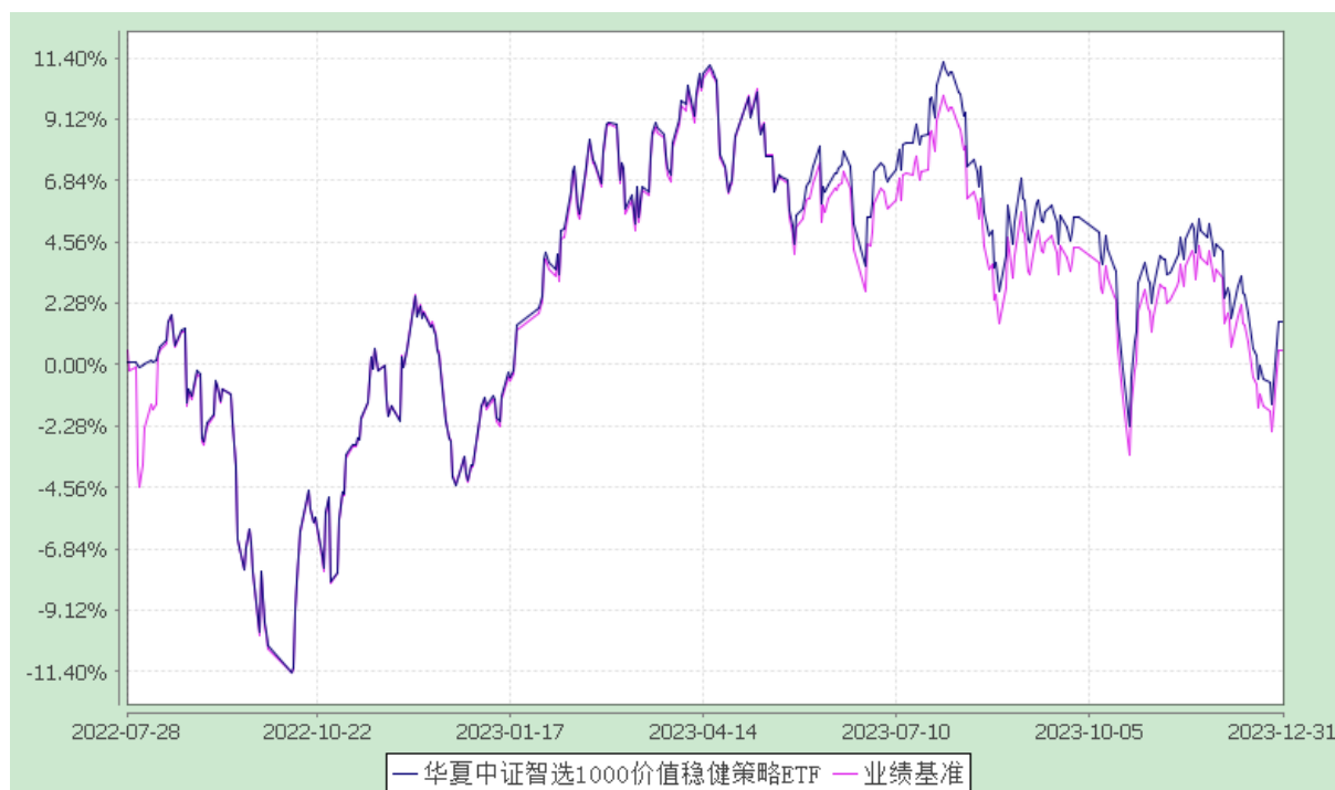
华夏中证智选 1000 价值稳健策略交易型开放式指数证券投资基金 份额累计净值增长率与业绩比较基准收益率历史走势对比图 (2022 年 7 月 28 日至 2023 年 12 月 31 日)

注：根据本基金的基金合同规定，本基金自基金合同生效之日起 6 个月内使基金的投资组合比例符合本基金合同中投资范围、投资限制的有关约定。