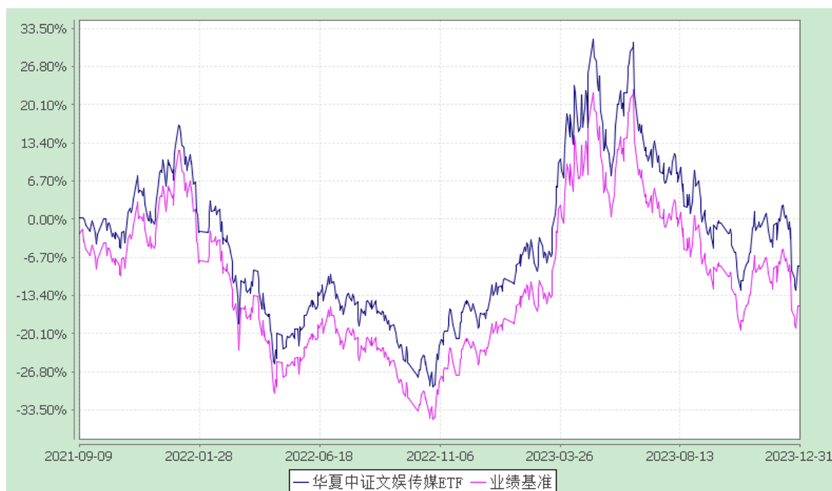
华夏中证文娱传媒交易型开放式指数证券投资基金 份额累计净值增长率与业绩比较基准收益率历史走势对比图 (2021年9月9日至2023年12月31日)