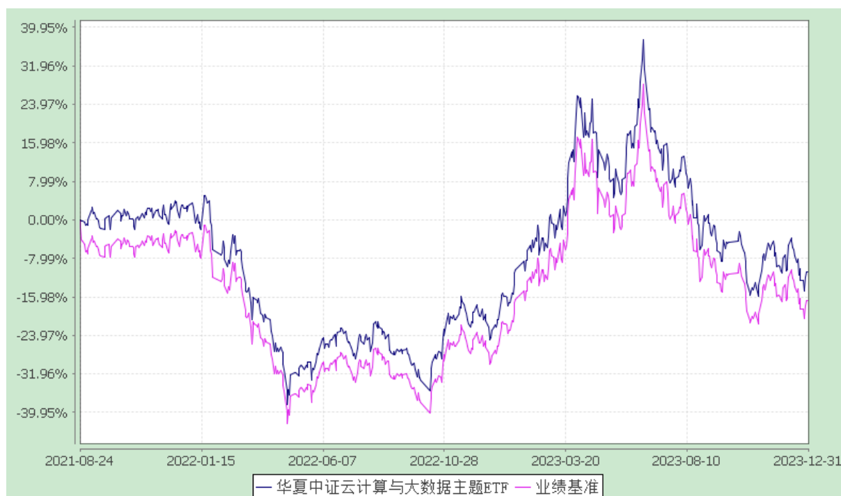
华夏中证云计算与大数据主题交易型开放式指数证券投资基金 份额累计净值增长率与业绩比较基准收益率历史走势对比图 (2021年8月24日至2023年12月31日)