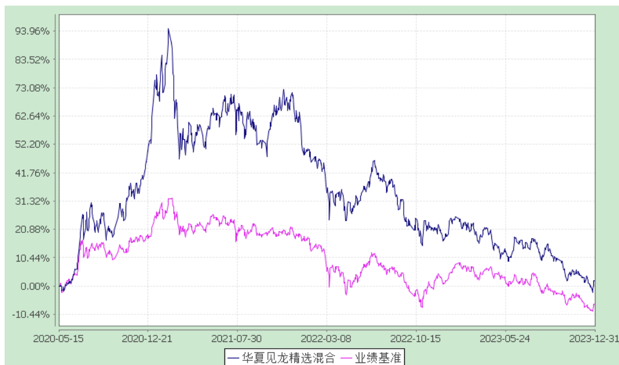
华夏见龙精选混合型证券投资基金 份额累计净值增长率与业绩比较基准收益率历史走势对比图 (2020年5月15日至2023年12月31日)